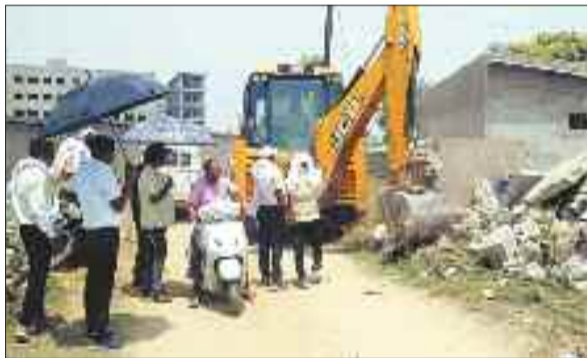
अतिक्रमण हटाते अधिकारी।

मची हुई है। अतिक्रमणकारियों के हौसले इतने बुलंद हैं कि वे बेखौफ होकर शासकीय भूमियों पर कब्जा कर रहे हैं।