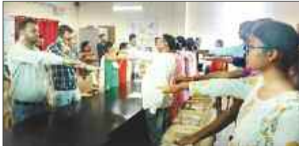
शपथ लेते हुए अधिकारी कर्मचारी।