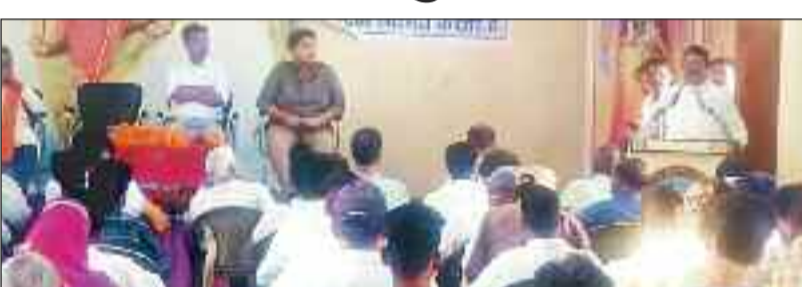
सभा को संबोधित करते उपसने।

जशपुरनगर। जिला मुख्यालय के सरस्वती शिशु मंदिर के सभागृह में आयोजित भारतमाता समिति के कार्यक्रम एवम भारत माता की महा आरती में सम्मिलित होने रायपुर से जशपुर पहुंचे लोकतंत्र प्रहरी के राष्ट्रीय अध्यक्ष सच्चिदानंद उपसने। उपसने भाजपा के कई पदों को भी सुशोभित कर चुके हैं। यहां आयोजित कार्यक्रम में उद्बोधन के दौरान उन्होंने कहा कि इन काम उन्न के बच्चों में राष्ट्र प्रेम देखकर ऐसा महसूस हो रहा है कि देश के नवयुवक सही रास्ते पर चल रहे हैं। अब हमारा राष्ट्र सुरक्षित है। उपसने ने आगे कहा की हर युवा के अंदर राष्ट्रप्रेम और राष्ट्र भक्ति होनी ही चाहिए। अभी के युवा मोबाइल और टीवी की संस्कृति में जी रहे हैं। हम