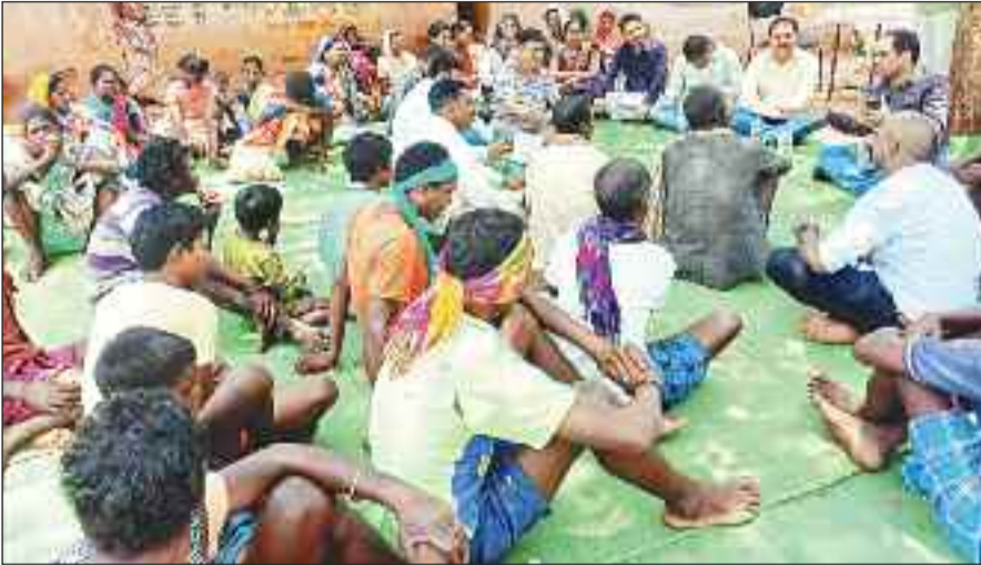
पहाड़ी कोरवाओं के समस्या की जानकारी लेते अधिकारी।